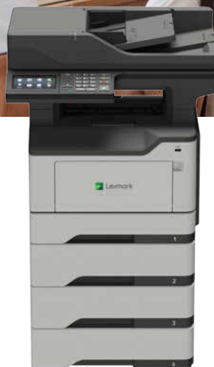
XM1246 con vassoi opzionali